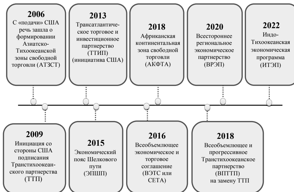
Рис. 1. Хронология развития мегарегиональных соглашений в XXI в. в контексте трансформации мирового пространства из однополярного в многополярное

Для соблюдения баланса в международных отношениях США также инициировали в 2013 г. создание Трансатлантического торгового и инвестиционного партнерства (ТТИП) – соглашения между США и ЕС (рис. 1). Это соглашение должно было изменить полностью систему глобального управления мировой экономикой, основываясь на ликвидации тарифных ограничений и некоторых нетарифных ограничений международной торговли (Мамедова, 2020). Главным отличием ТТИП от предыдущих интеграционных объединений было намерение повысить эффективность международной торговли за счет гармонизации ее правил, а не за счет улучшения доступа на рынки стран – участниц соглашения.