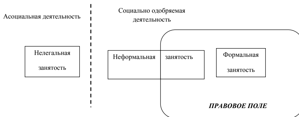
Рис. 1. Связь нелегальной, неформальной и формальной занятости