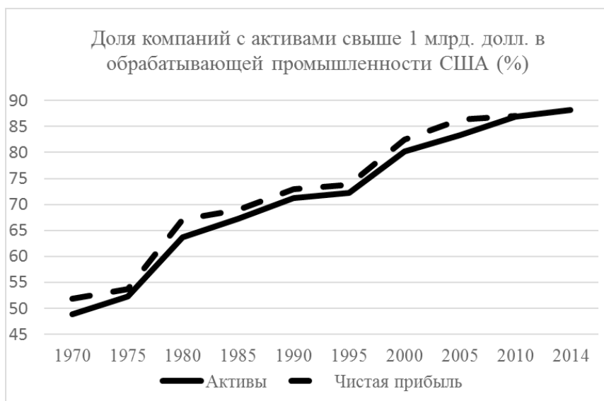
Рис. 2. Доля компаний с активами свыше 1 млрд долл. в обрабатывающей промышленности США (%)