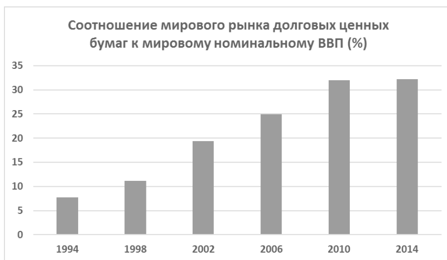
Рис. 1. Соотношение мирового рынка долговых ценных бумаг к мировому номинальному ВВП (%)

Ежедневные операции на мировых валютных, кредитных и финансовых рынках в 50 раз превышают стоимость сделок в мировой торговле товарами (Шушков, 2012. С. 3). Если соотнести объёмы мирового рынка облигаций с объёмом номинального мирового ВВП, можно обнаружить, что значение этого показателя выросло с 7,7% в 1994 г. до 32,2% в 2014 г. (рис. 1).