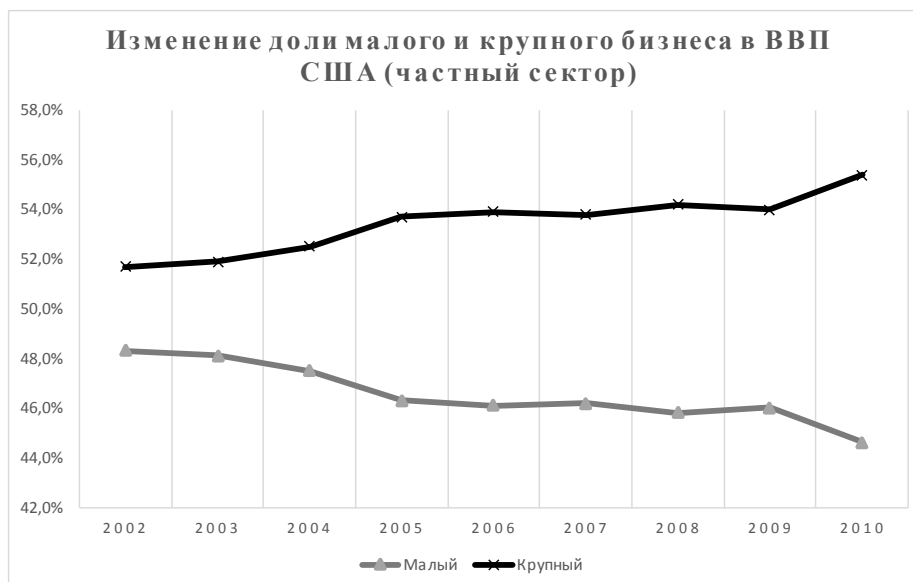
Рис. 4. Изменение доли малого и крупного бизнеса в ВВП США (частный сектор)

Крупные предприятия играют всё более значимую роль в современной экономике по сравнению с малым и средним бизнесом. Доля крупного бизнеса в ВВП США с 2002 по 2010 гг. выросла на 3,7%, достигнув уровня в 55,4%. Доля малых компаний постепенно падает (рис. 4).